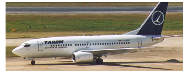
Tabel nr. 3: Durata cumulată a deplasării pe căi aeriene și rutiere de la Alba Iulia la București și la alte 30 de centre urbane din România, Europa, Africa și Asia 10