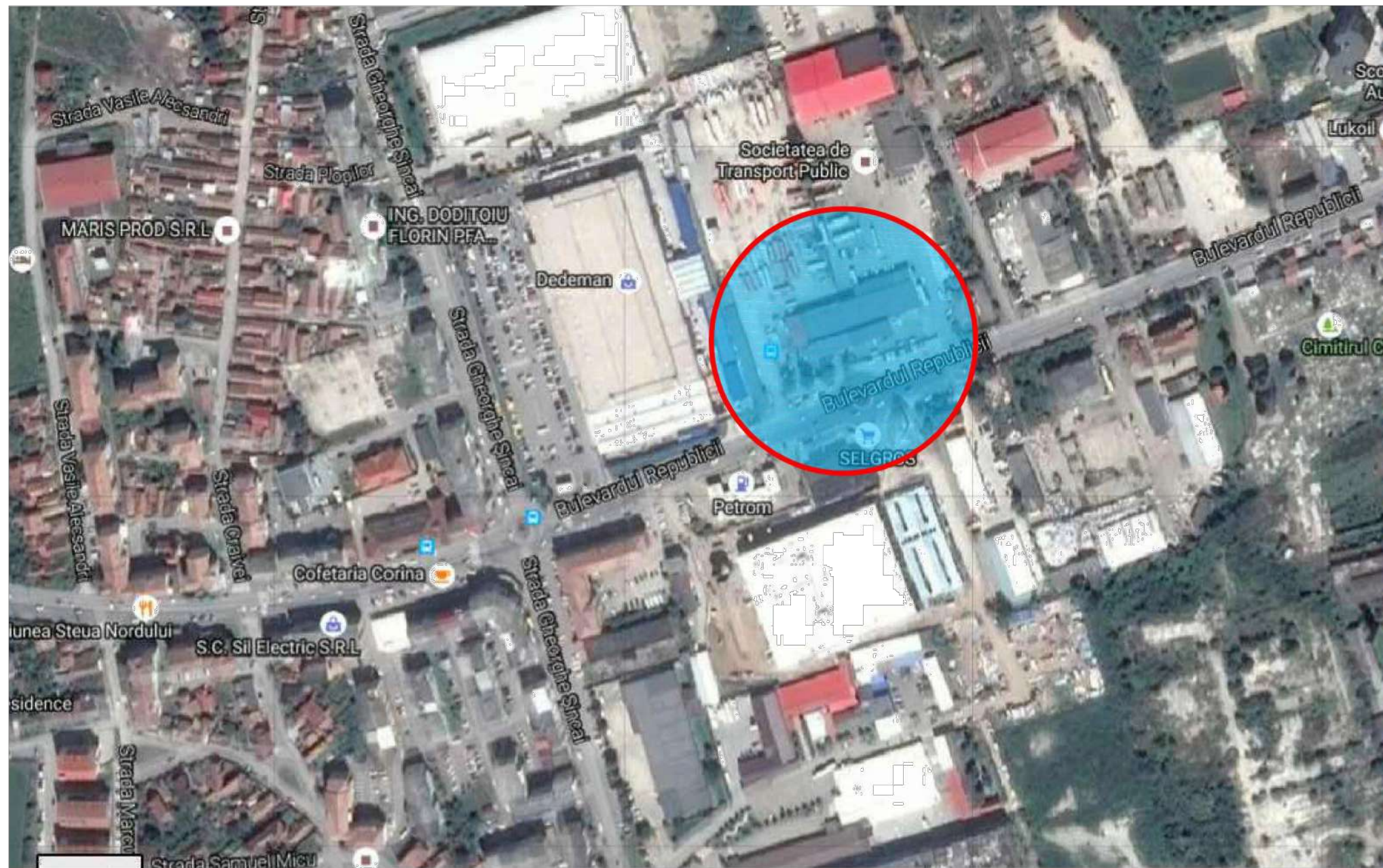
INCADRARE IN TERITORIU